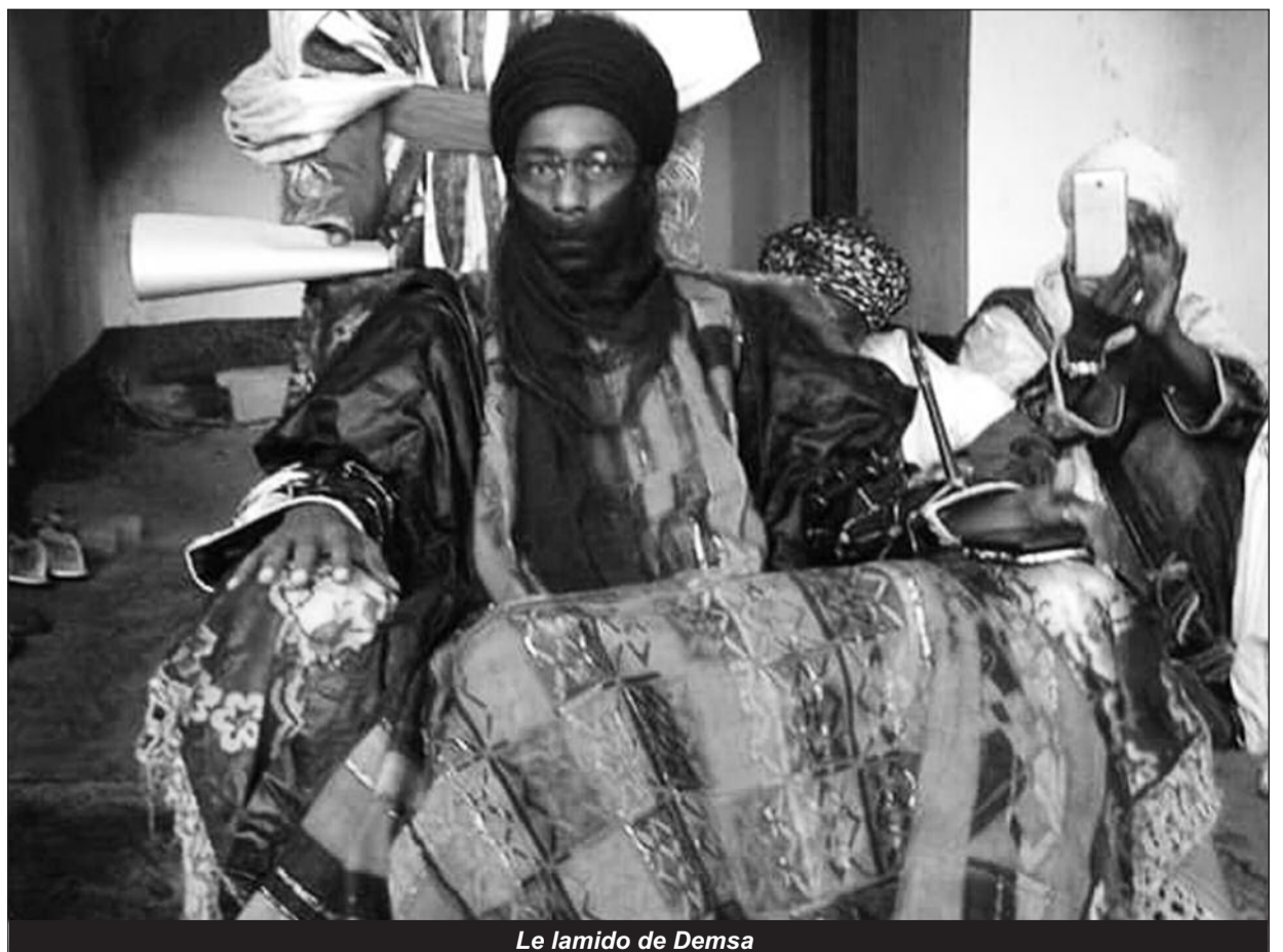
Le lamido de Demsa

Cette fête revêt une dimension forte pour toutes les populations du Lamidat de Demsa puisqu'elle illustre le grand attachement du