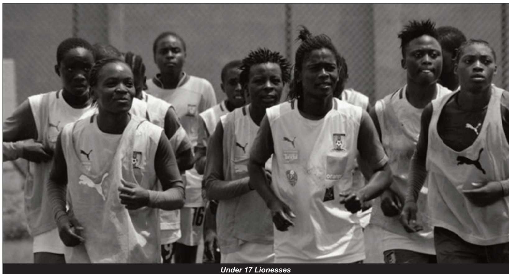
Under 17 Lionesses