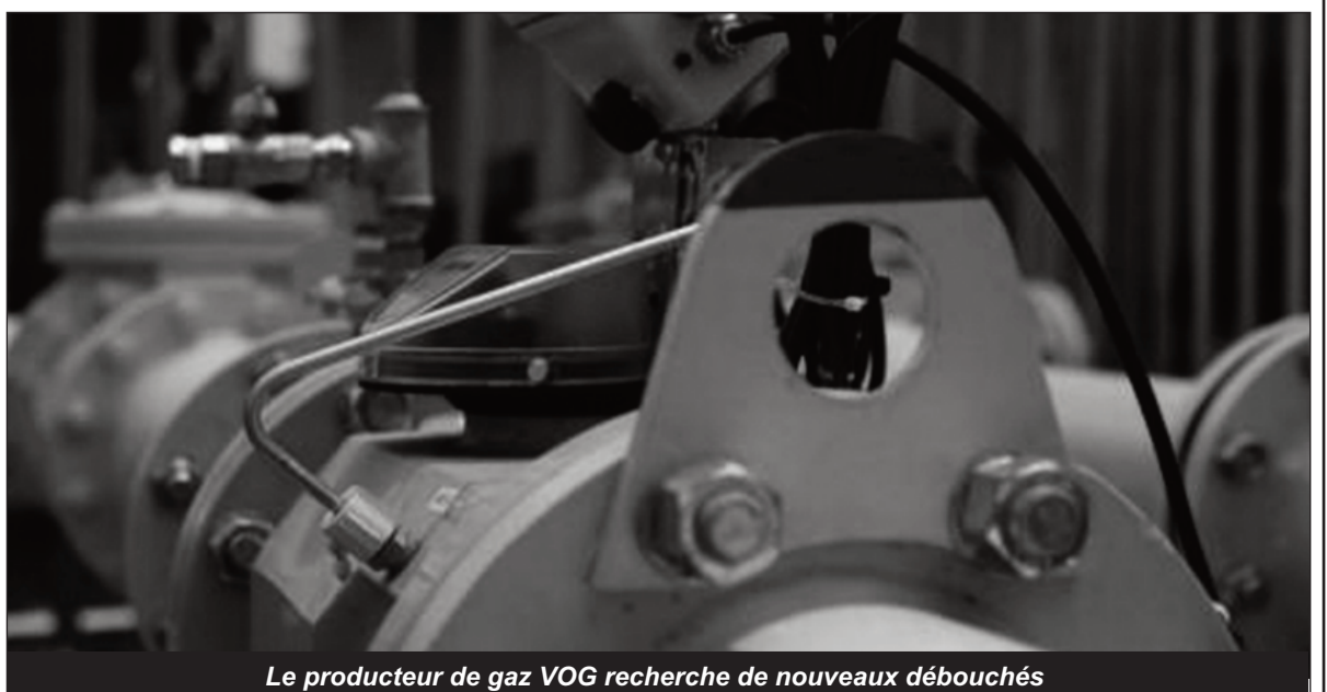
Le producteur de gaz VOG recherche de nouveaux débouchés