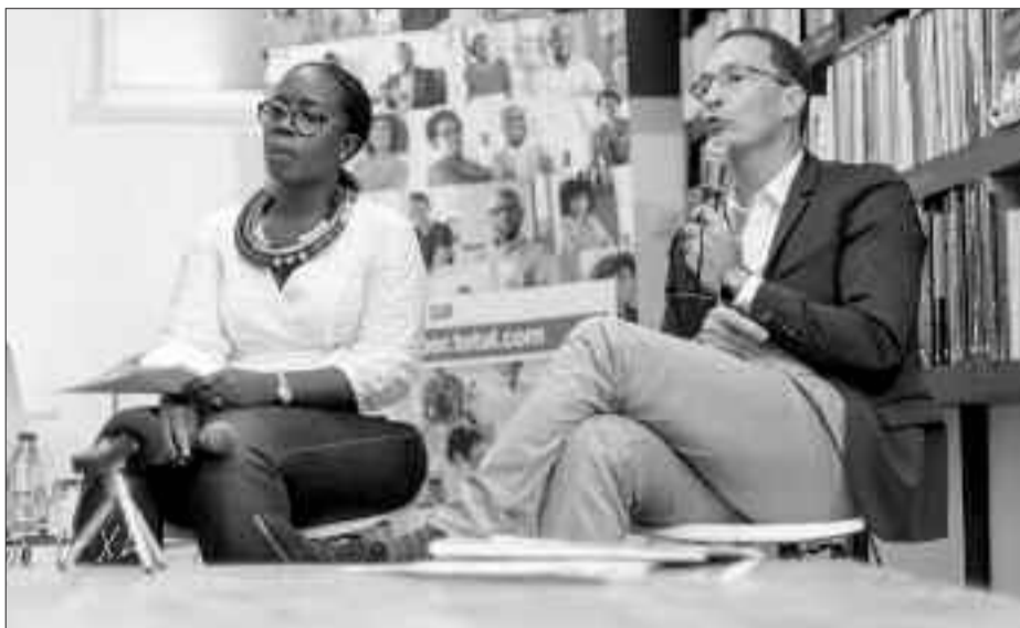
Impact social indéniable.