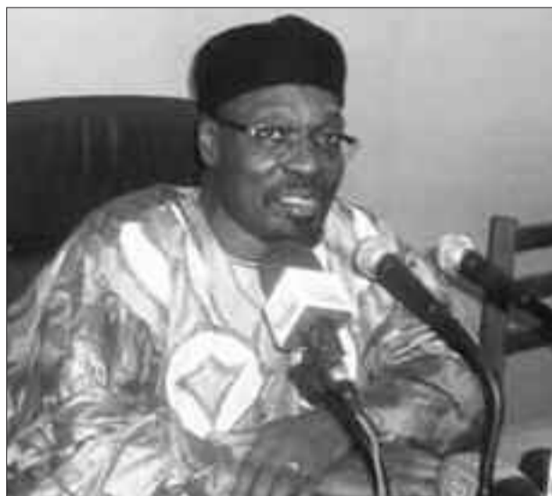
Issa Tchiroma Bakary.

Les travaux de la commission nationale d'examen des demandes d'accès au bénéfice de l'aide publique à la communication privée se sont tenus vendredi 26 octobre dernier. 135 dossiers pour une enveloppe de 240 millions Fcfa toutes taxes comprises ont été examinés dans la salle de réunion du ministère de la Communication (Mincom), sous l'égide de Issa Tchiroma Bakary, responsable de ce département ministériel. Ce dernier admet la modicité du montant alloué aux organes de presse privée : «une fois de plus, ce montant est insignifiant par rapport à la robustesse de notre presse. La responsabilité du gouvernement consistant à faire l'échelle courte à la presse pour qu'elle parte des organes de presse à des entreprises de presse ». Mais, le Mincom note que cela est lié au contexte sécurité auquel l'Etat du Cameroun est confronté. «N'oubliez quand-même pas que nous sommes encore en guerre contre Boko Haram dans la par-