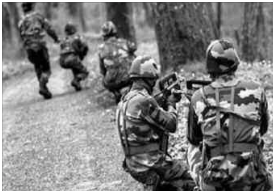
Des soldats au front.

Sur le même sujet, la France, par la voix de son ministère des affaires étrangères, appelle au « lancement d'un dialogue politique inclusif, seul à même de permettre la résolution d'une crise qui s'est aggravée durant l'année écoulée et a des conséquences pour les populations concernées ». Le ministre britannique en charge de l'Afrique, Harriet Bald-