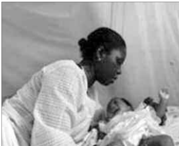
Tous pour une meilleure santé de la mère et de l'enfant.

Ces deux projets cofinancés par la Banque islamique de développement (Bid) dont le montant de mise en œuvre s'élève à 36 milliards Fcfa vise « la réduction de la mortalité maternelle, néonatale et infanto-juvénile, et l'accès de tous