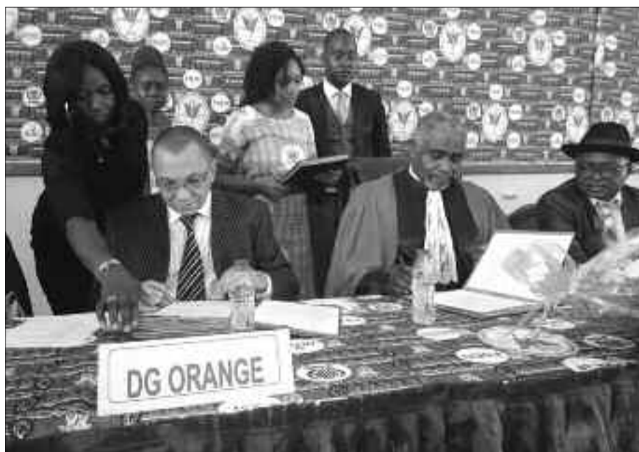
Le Recteur et le représentant du Dg paraphent les documents.

Le 25 octobre dernier, une convention de partenariat a été signée entre Orange Cameroun et l'Université de Yaoundé II-Soa. Un accord qui s'inscrit dans le cadre de la digitalisation que l'entreprise de télécommunications a entreprise dans les universités du Cameroun. L'objectif étant, d'après le représentant du directeur général d'Orange, d'accompagner les jeunes étudiants dans leur évolution avec les technologies de l'information et de la communication (tic) et dans la mise en place d'un accompagnement en entreprise. Il est également question pour Orange Cameroun de participer de manière permanente à l'évolution de leurs cursus en matière de technologie. Pour atteindre cet objectif, l'entreprise