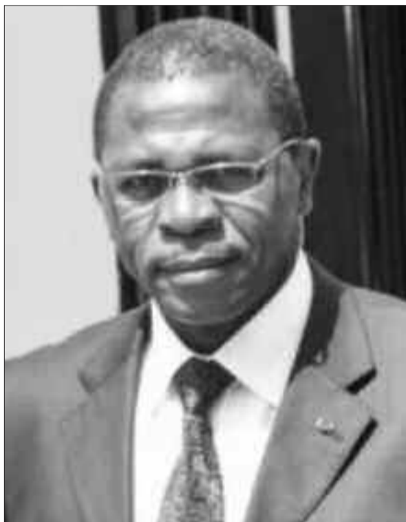
Paul Atanga Nji. Le Minat.

Paul Atanga Nji rappelle qu'avec la proclamation, le 22 octobre dernier, des résultats de l'élection présidentielle par le Conseil constitutionnel, « le processus électoral est terminé ». Et dit regretter que le candidat du Mrc, après avoir fait valoir ses arguments devant les juges constitutionnels,