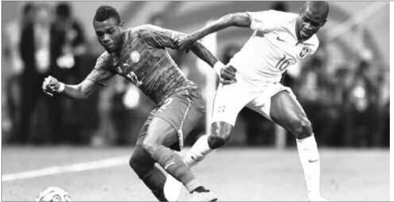
Brésil- Cameroun en 2014.

De l'autre côté, les Lions indomptables seront face à une équipe Sud-américaine, une première sous l'ère Clarence Seedorf. Ce face à face interviendra quatre jours après la rencontre Maroc-Cameroun, comptant pour les éliminatoires de la Coupe d'Afrique des nations (Can) de football 2019. Le sélectionneur brésilien a d'ores et déjà dévoilé la liste des 23 pour cette rencontre. Tite a fait appel à tous ses meilleurs éléments