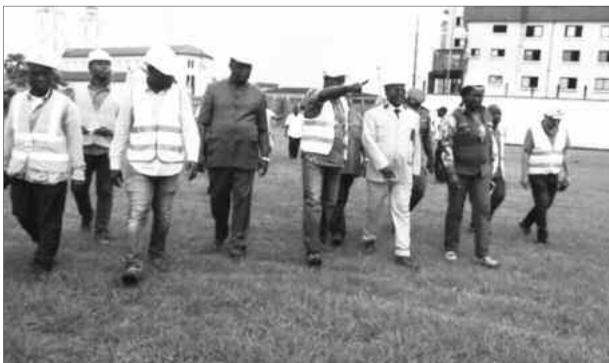
Visite du chantier.

Le président du comité des sites a également demandé à Yenigün de mettre à la disposition de la mission de sécurité Caf/Fifa, le plan de sécurisation du stade, au cours de sa visite de travail annoncée demain mardi, 30 octobre. La consigne a aussi été donnée à l'entreprise Magil