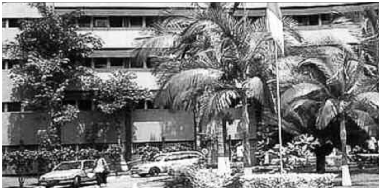
Une vue du Minfopra.

Le nombre de places est reparti entre 21 spécialités: Allemand (15), Chimie (25), Economie (20), Espagnol (15), Géographie (30), Histoire (30), Informatique (20), Lettres bilingues (25), Lettres modernes anglaises (20), Lettres modernes françaises (25), Mathématiques (35), Physique (25), Sciences de l'éducation (20), Sciences de la vie et de la terre (25), Italien (10), Langues anglaises et littérature d'expression anglaise (15), Langues françaises et littérature d'expression française (15), Langues et cultures camerounaises (05), Biologie (25), Arabe (10), Géologie (15). Les professeurs des lycées désireux de prendre part à ce concours prévu pour le 16 décembre prochain au centre unique de Yaoundé devraient être âgés de «50 ans au plus au 1er janvier 2018, [avoir] une ancienneté de cinq années de service effectif dans le grade à la date du concours». Ils ont jusqu'au 30 novembre prochain pour candidater auprès du Minfopra notamment à la direction du développement des ressources humaines de l'Etat ou des délégations régionales de la fonction publique. Candidature actée d'une réception par le postulant d'un récépissé.