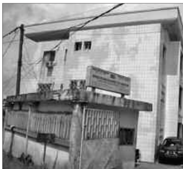
Yaoundé. Le siège de l'Obc.

Cette réforme du GCE Board arrive après celle opérée au sein de l'Office du baccalauréat du Cameroun (Obc). A la faveur d'un décret présidentiel du 18 octobre dernier, la structure connaît également un changement dans son management. L'organe chargé d'organiser les examens officiels du 2nd cycle du sous-système éducatif francophone est désormais placé sous l'autorité d'un conseil d'administration. Lequel comprend sept membres dont un représentant de la présidence de la République, un représentant des services du Premier ministre, un représentant du ministère des Enseignements secondaires et un représentant du personnel de l'office élu par ses pairs. Ils sont nommés par un décret du président de la République pour un mandat de trois