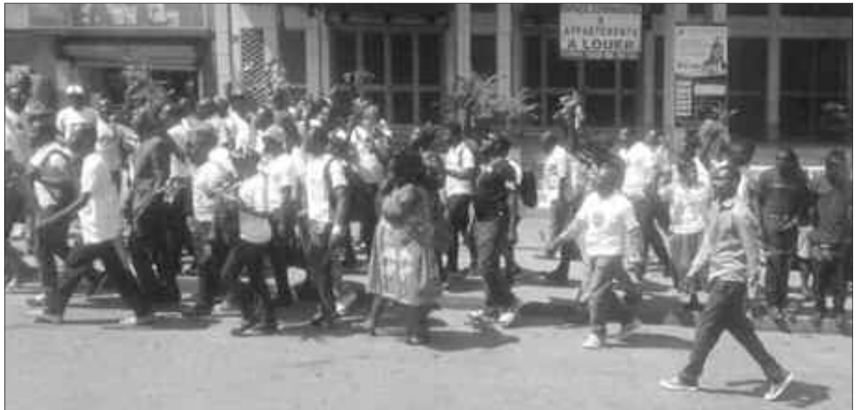
Climat post-électoral surchauffé.

font le tour des réseaux sociaux depuis samedi dernier. L'avocate projetait de traverser à pied, en compagnie de son groupe, l'ancien pont sur le Wouri, investi quelques heures plus tôt par les éléments de la police et de la gendarmerie.