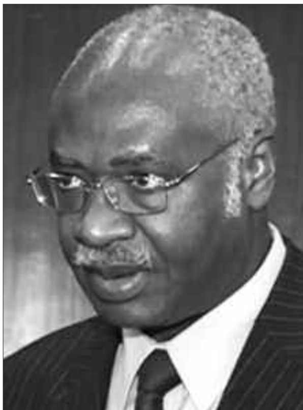
Philemon Yang. Premier ministre.

La Cahb est restée muette sur la question. Elle ne s'est tout au moins pas appesantie sur le dossier Cameroun, lors de la session de son comité exécutif du 26 octobre dernier. L'instance faitière du handball africain s'est plutôt penchée sur les éditions 2022 et 2024. Laissant le suspense perdurer pour le rendez-vous de 2020. Le Cameroun avait jusqu'à vendredi dernier pour rassurer la Cahb de sa disponibilité à organiser cet évènement. L'édition 2022 attribuée au Sénégal et celle de 2024 au Cap Vert et l'Algérie ont été le point culminant de cette assise d'Abidjan en Côte d'Ivoire. « Je crois que le comité d'urgence va siéger pour en décider », conclut notre informateur.