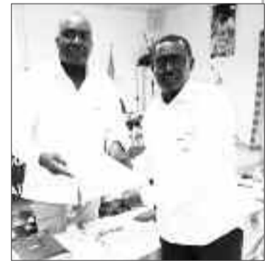
Attribution de la Can 2022 au Sénégal.

Le Sénégal s'est vu désigner par la Confédération africaine de handball (Cahb) pour accueillir les Championnats d'Afrique dames de la discipline en 2022. C'était vendredi 26