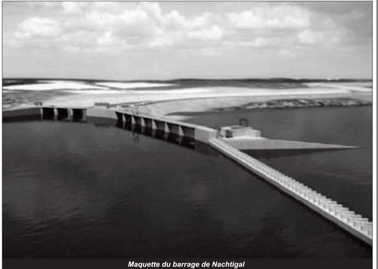
Maquette du barrage de Nachtigal

«Le projet de Nachtigal, l'un des très rares partenariats public-privé (PPP) à avoir vu le jour dans le secteur de