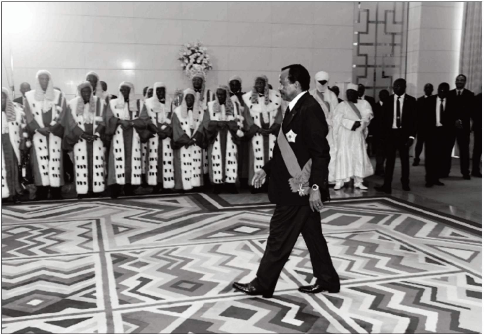
A l'extrême droite les mains croisées, il est là.

De plus en plus, et ce, subtilement et silencieusement, il occupe l'espace. Et on a bien observé que les rapports entre Chantal Biya et lui, ont été pacifiés. Justement, le 06 novembre dernier, on a vu les deux échanger avec beaucoup de gaieté. On était alors loin de l'image du 07 octobre 2018, lorsque dans le bureau de vote où Paul Biya devait glisser son bulletin