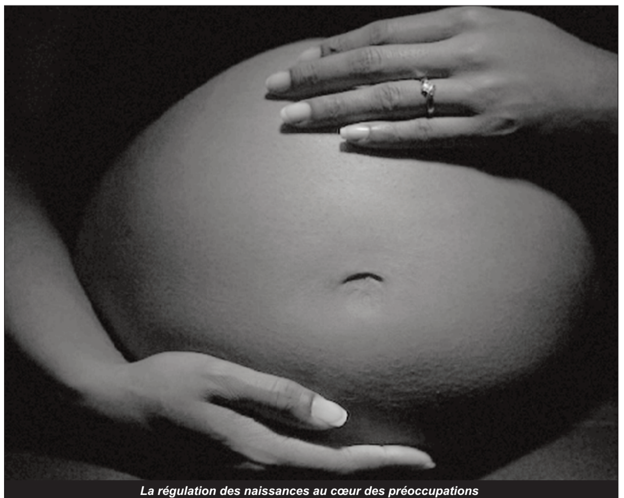
La régulation des naissances au cœur des préoccupations

A titre de rappel, l'ambition du Cameroun et des pouvoirs publics est de soutenir toutes les initiatives visant à réduire les