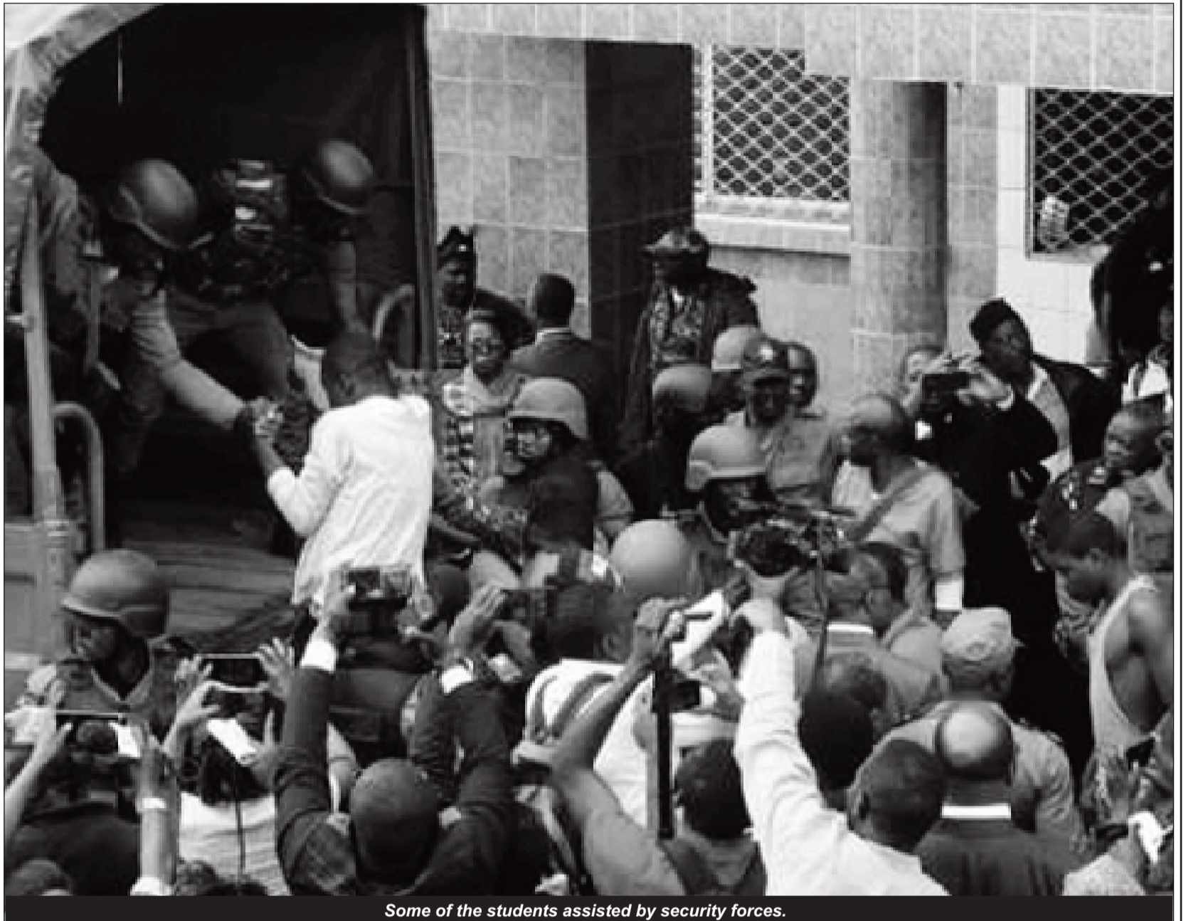
Some of the students assisted by security forces.

We are told that tears of joy and happiness characterized the parents of the two students that were still in the hands of the kidnapers when they learned that their children have been released. It has also been alerted that these parents were passing sleepless nights since the release of the 78 other students last week. They have been praying and hoping that their own children be released from abduction and thank their prayers were therefore answered as the two students have fi-