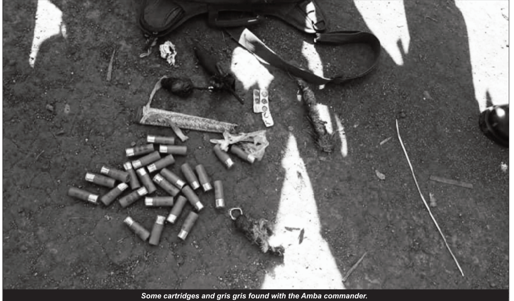
Some cartridges and gris gris found with the Amba commander.

In Bui Division of the same region, another operation carried out by the police on