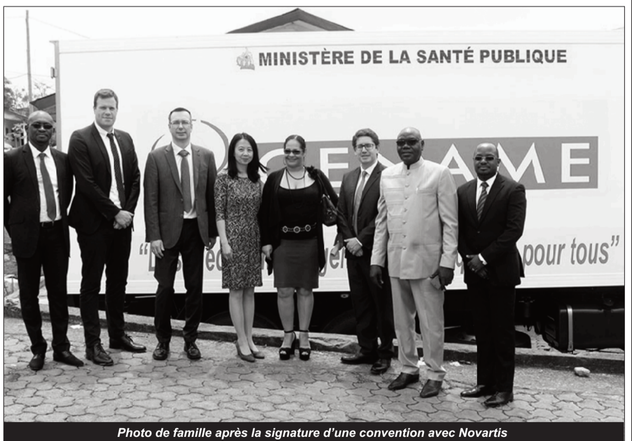
Photo de famille après la signature d'une convention avec Novartis