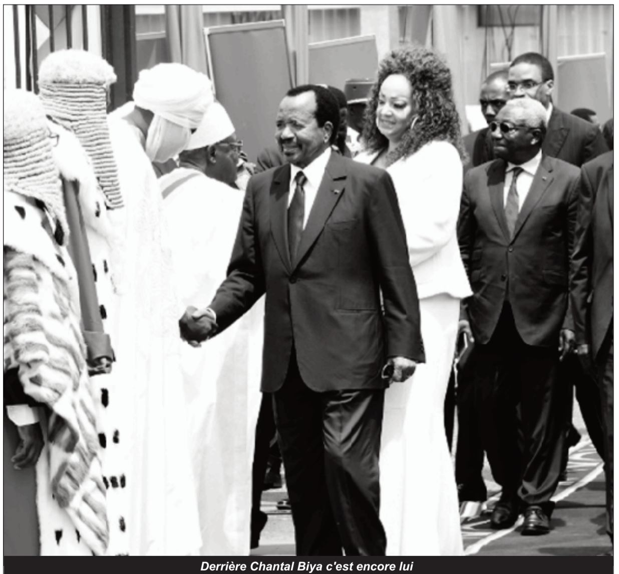
Derrière Chantal Biya c'est encore lui

estimation que cela aurait du mal à passer, le Cameroun n'étant ni le Gabon ni la Guinée Equatoriale, encore moins le Togo. Seulement, Franck Biya est pour Paul Biya une garantie absolue pour la protection des