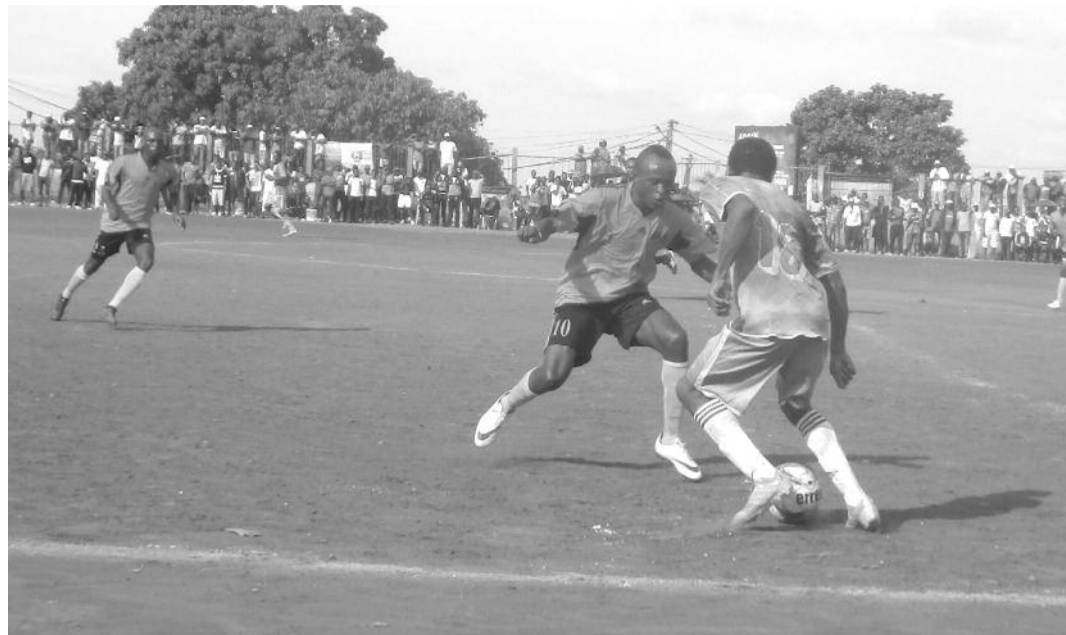
Yaoundé, le 4 novembre 2018. Stade des sapeurs-pompiers de Mimboman. As Fap - Fauve Azur (0-0).

Barrages dans le Centre. Les deux équipes devront livrer un match d'appui pour déterminer le finaliste de la poule B après le match nul (0-0) d'hier.