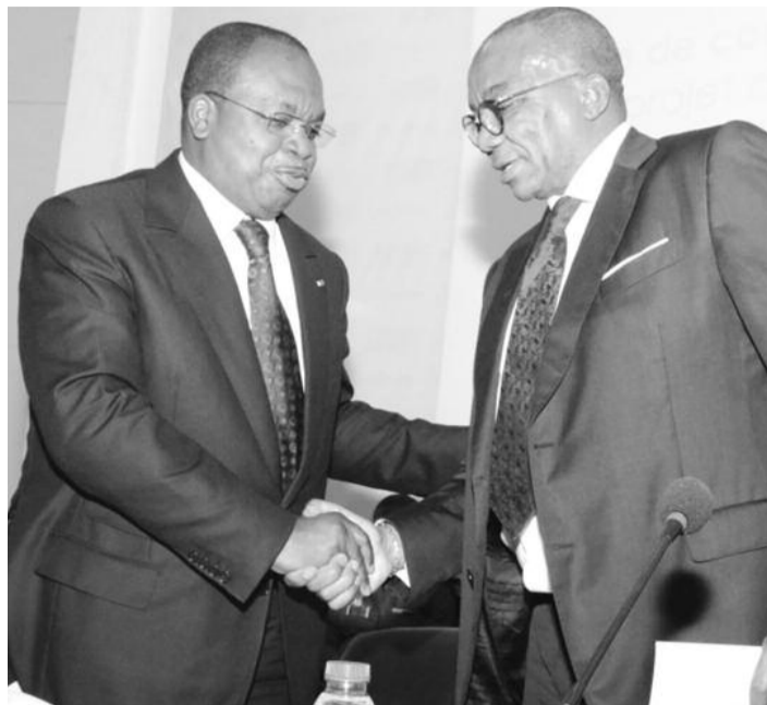
Le Minfi et le président du Gicam.

Réformes fiscal-douanières. Les taux de recevabilité des suggestions transmises le 28 mai 2018 par le Groupement inter patronal du Cameroun, sont respectivement de 73% et 71%. Les deux parties se sont à nouveau concertées le 02 novembre à Douala.