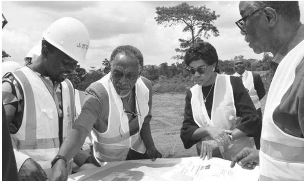
Yaoundé. la Dg l'Autorité Aérienne (au milieu) lors du lancement des travaux de construction de l'immeuble siège.

Contrat. L'entreprise chinoise va construire le siège de l'aviation civile camerounaise.