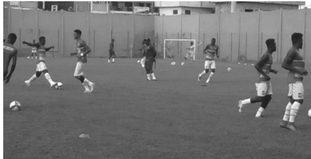
Yaoundé, le 4 novembre 2018. Stade annexe n°1 de l'Omnisports. Les Lions U23 à l'échauffement avant le match contre Leopard de Douala (0-1)

Amical. Les poulains de Rigobert Song se sont inclinés (0-1) hier, 4 novembre 2018 au stade Annexe n°1 de l'Omnisports de Yaoundé.