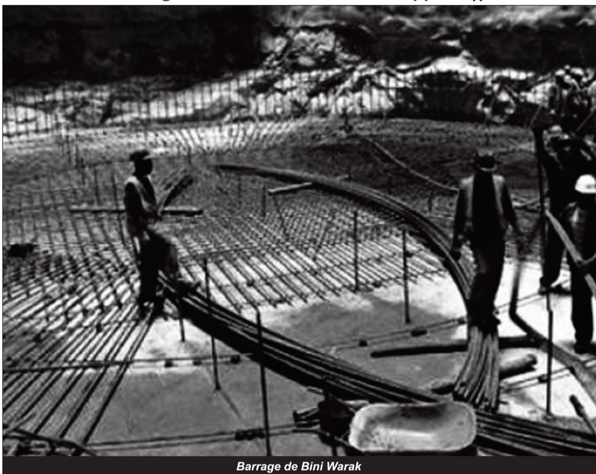
Barrage de Bini Warak