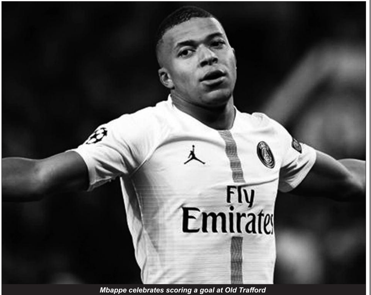
Mbappe celebrates scoring a goal at Old Trafford