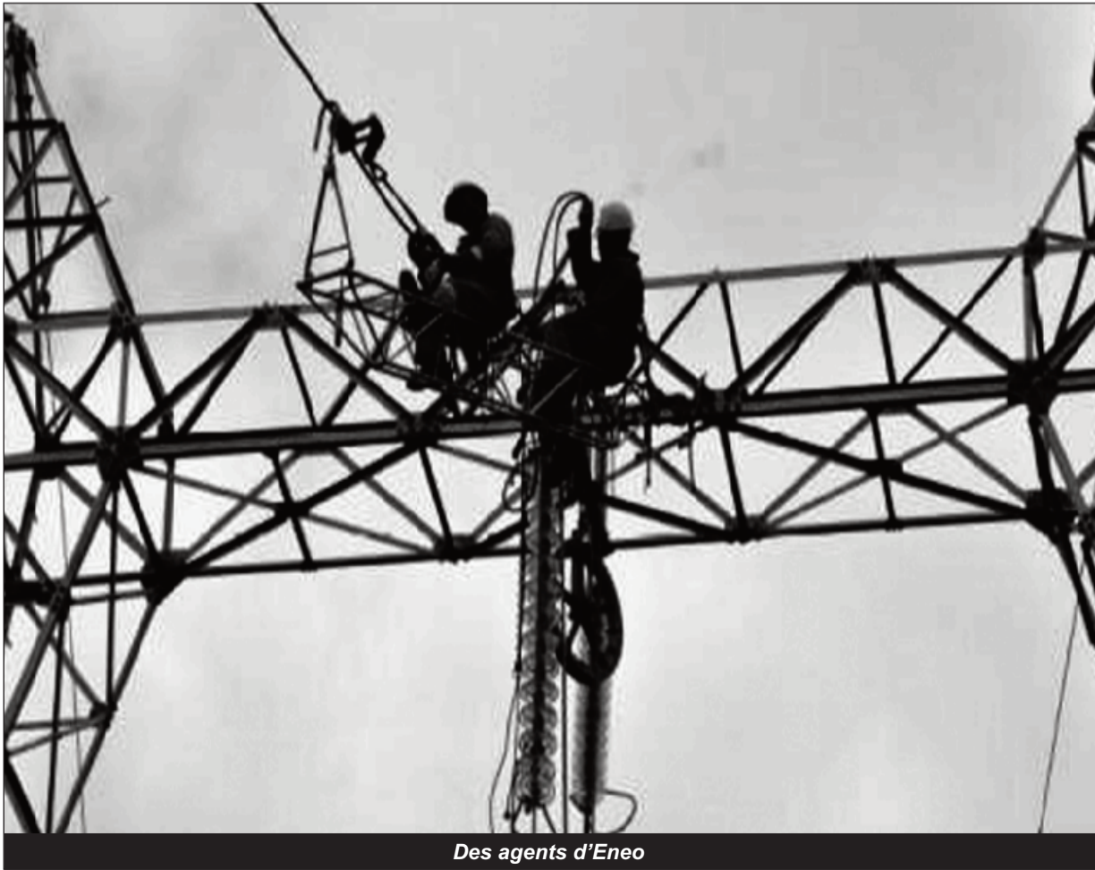
Des agents d'Eneo