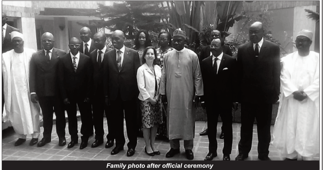
Family photo after official ceremony