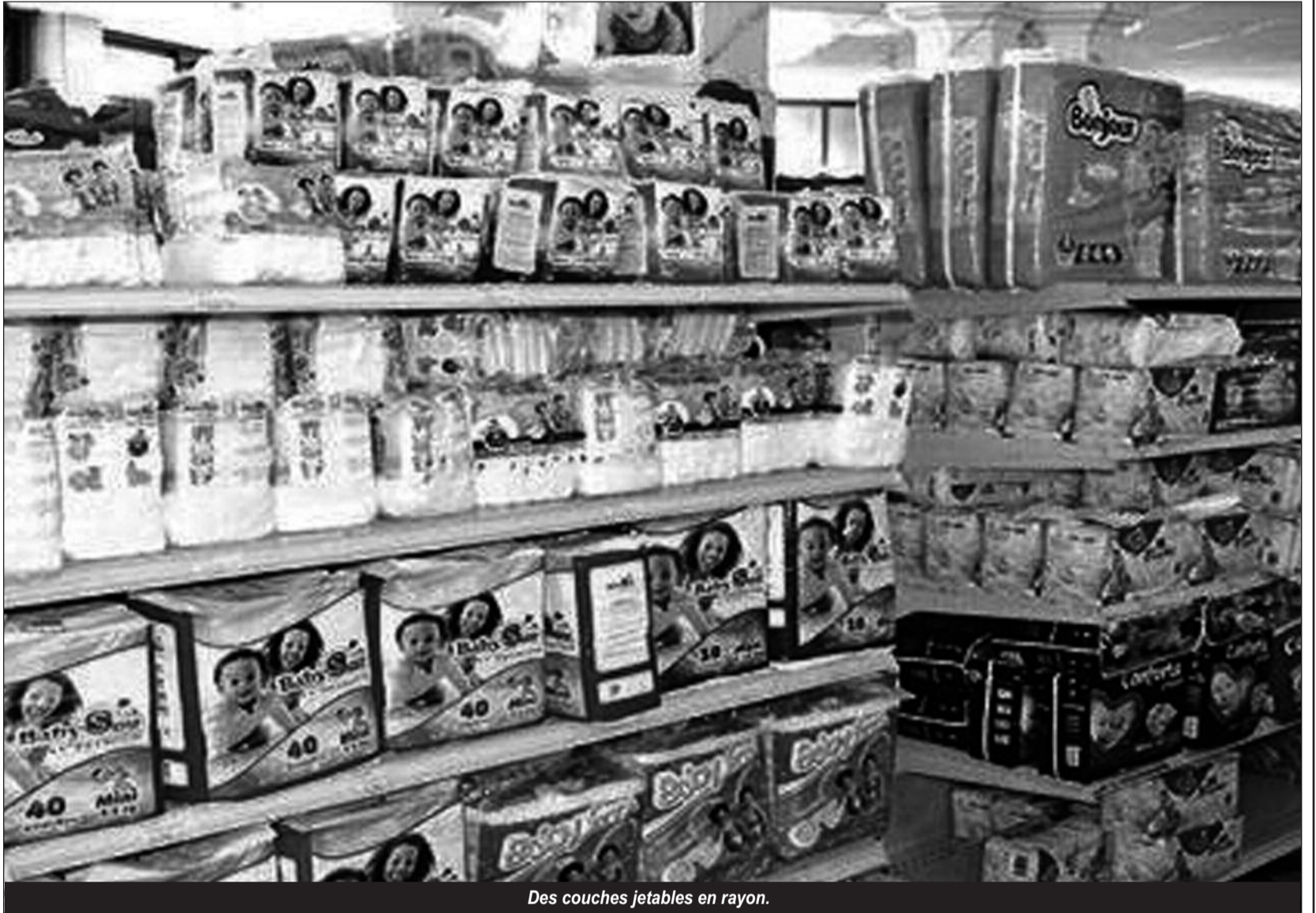
Des couches jetables en rayon.