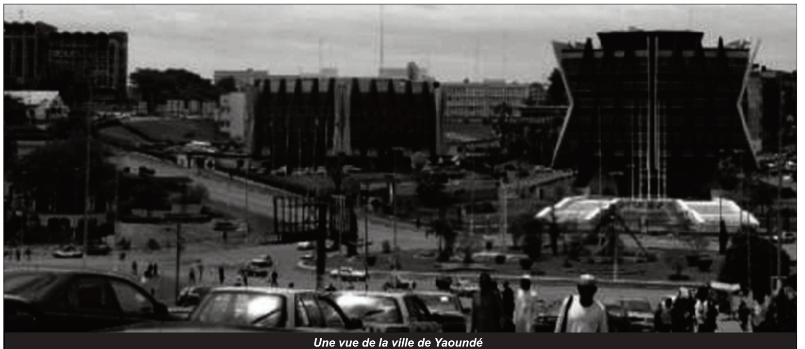
Une vue de la ville de Yaoundé