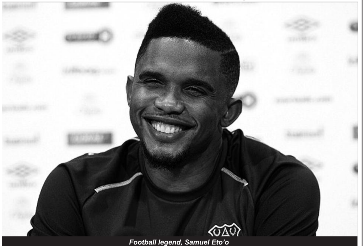
Football legend, Samuel Eto'o

scorer in the Nations Cup with 18 goals and he appeared at four World Cup finals - 1998, 2002, 2010 and 2014 - playing in eight