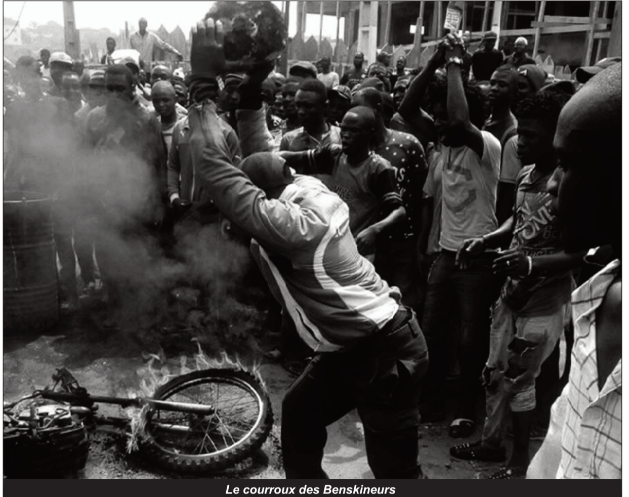
Le courroux des Benski-neurs

Yaoundé, après l'interpellation de l'un d'eux par les gros bras de la police municipale, il s'en est suivi une altercation qui a malheureusement conduit au décès du jeune conducteur de moto, qui a reçu des coups mortels lors de la bagarre. « Il a dit au gars de la mairie que c'est bon, tu as pris ma moto, mais remets juste la clé de ma chambre qui se trouve dans le troussseau de clefs. Comme le gars de la mairie s'entêtait à partir avec la clef de sa chambre, il a engagé une résistance et la bagarre a commencé. Il saignait abondamment, il a été conduit à l'hôpital Central avant de mourir », relate un témoin de la scène. En guise de réaction, ses collègues ont à leur tour pris en chasse d'autres agents de la police municipale. Le théâtre des événements se déroule plus précisément au lieu-dit "Shell Elig-Edzoa" où une voiture et une moto des agents de la