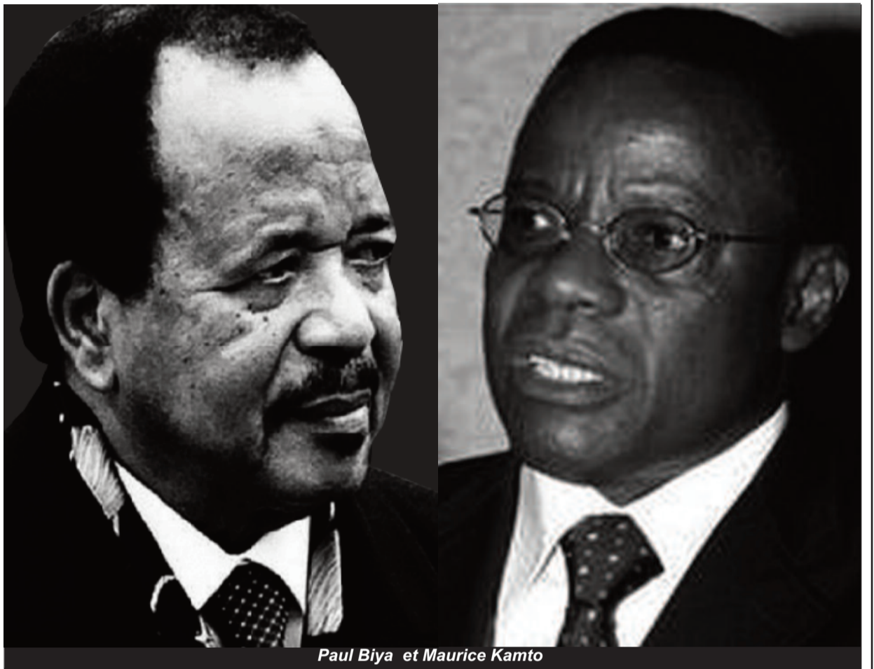
Paul Biya et Maurice Kamto