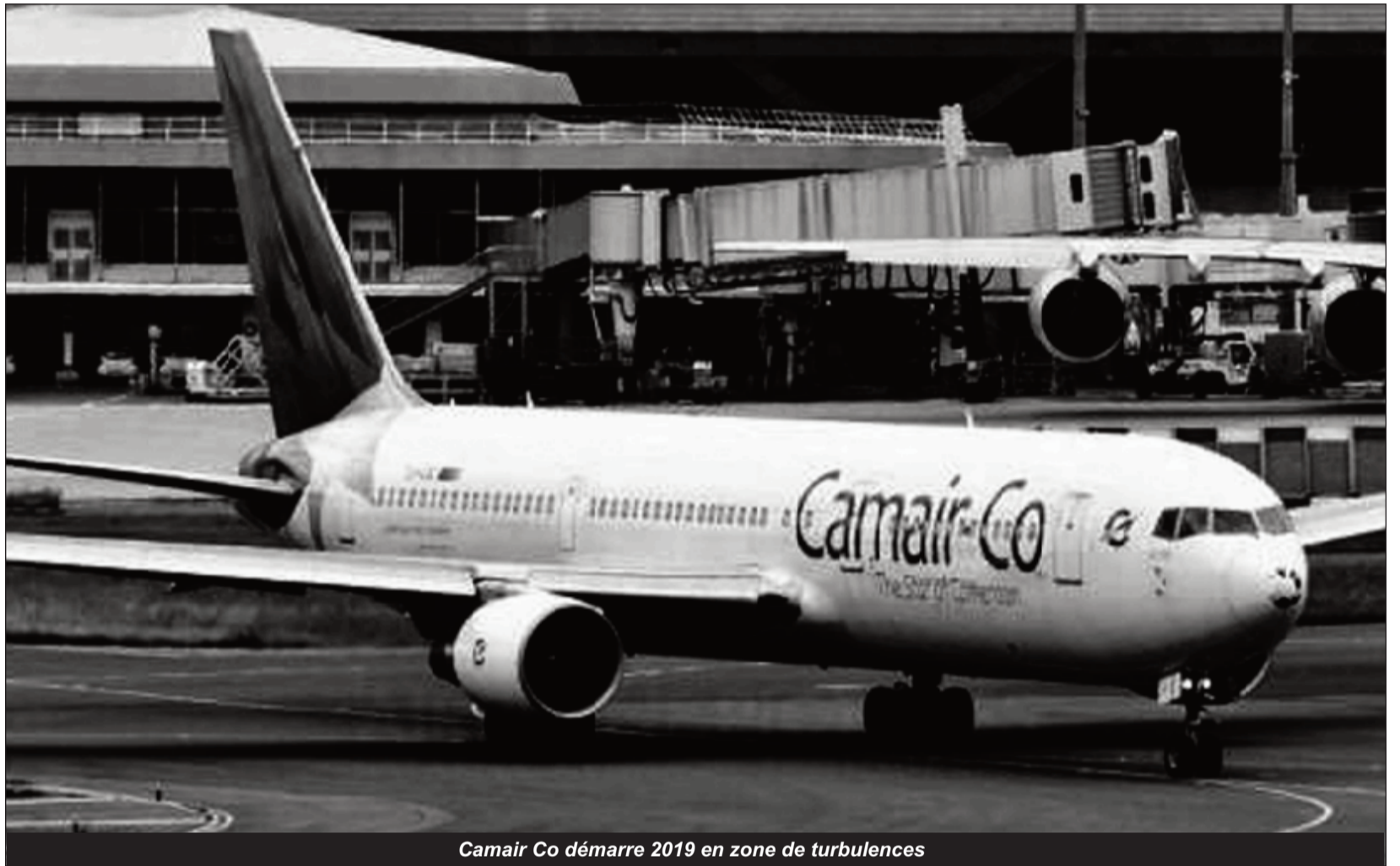
Camair Co démarre 2019 en zone de turbulences

Pour le compte du mois de février 2019, le top management de la compagnie aérienne publique camerounaise projette un fléchissement encore plus important des revenus de