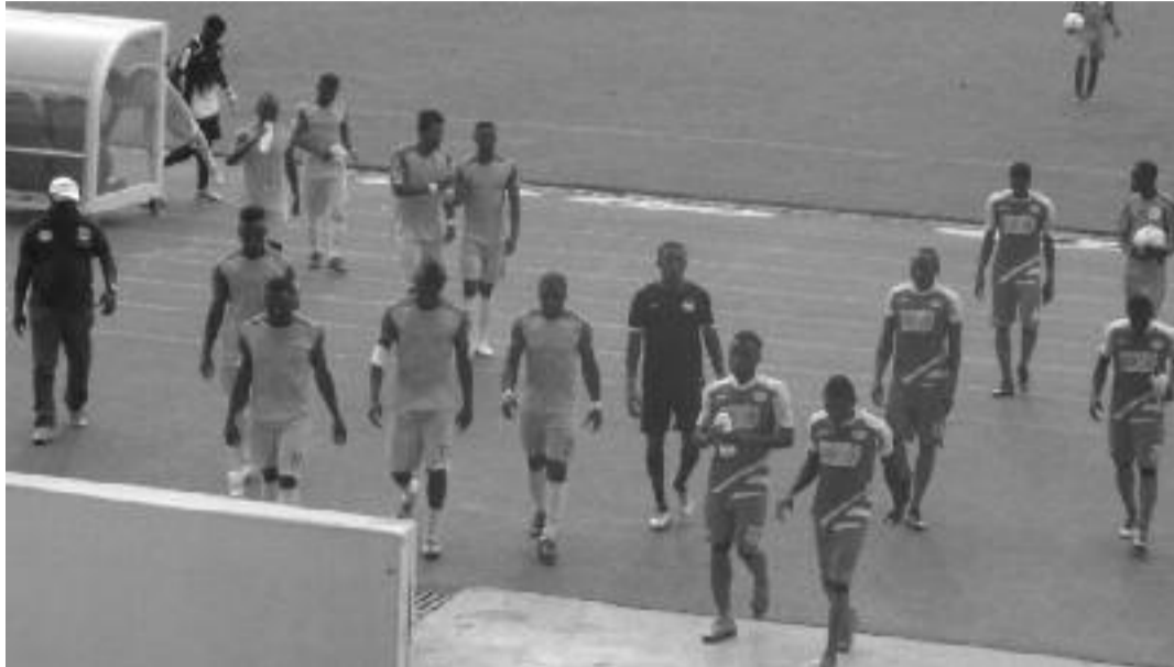
Yaoundé, le 13 février 2019. Stade Ahmadou Ahidjo. les joueurs de Panthère et Bang Bullet regagnant les vestiaires.

Ligue 2. Le Fauve du Ndé a battu son adversaire sur le score d'un but à zéro hier au stade Ahmadou Ahidjo de Yaoundé ; le club de Nkambé ayant manqué un penalty dans les derniers instants.