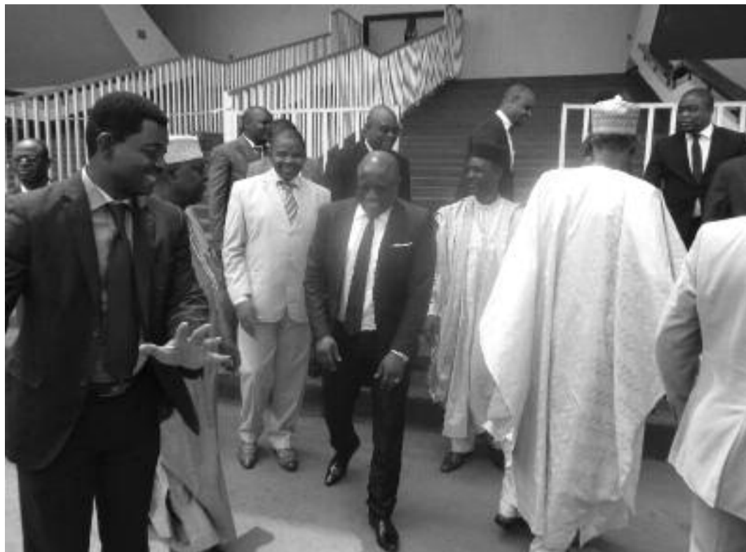
Yaoundé, le 13 février 2019. Les membres du Conseil d'administration de l'Anafoot à la fin de la session.

Anafoot. Il a été adopté à l'issue de la 4ème session de son Conseil d'administration tenue hier, à Yaoundé.