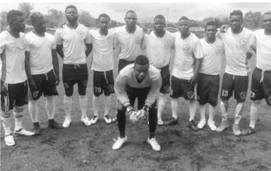
Volcan du Noum, une formation devant prendre part au championnat régional de l'Ouest.

Ligue régionale de l'Ouest. C'est qui ce ressort de la réunion préparatoire d'ouverture de la saison de football de cette région tenue le mardi, 12 février dernier.