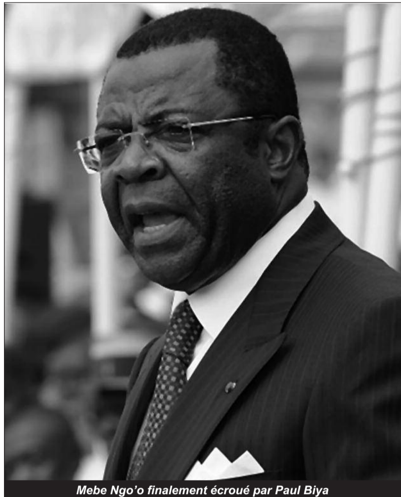
Mebe Ngo'o finalement écroué par Paul Biya