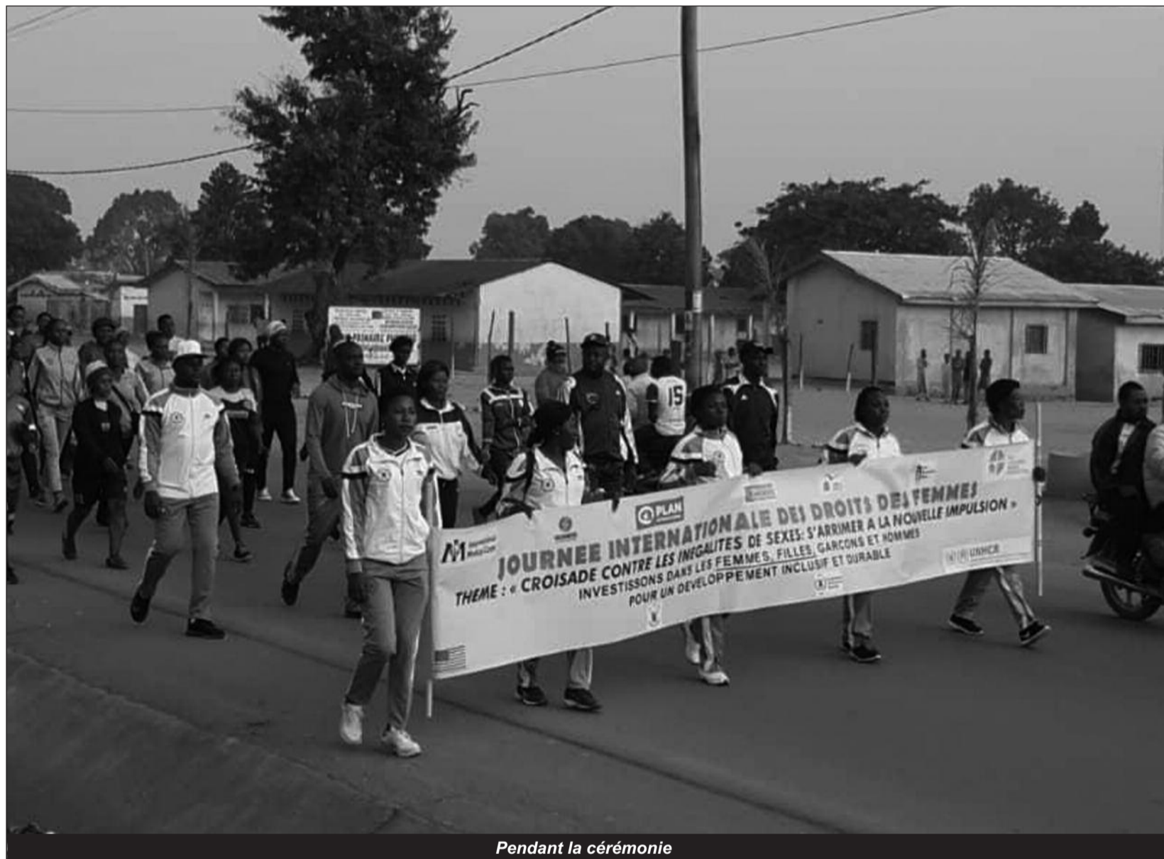
Pendant la cérémonie

L e coup d'envoi de cette marche a été donné par Laurence Diyem Jam, sous-préfet de l'arrondissement de Garoua Boulai à l'esplanade de l'ancienne sous-préfecture de la ville. Les femmes de toutes les couches sociales et de tous les âges. Les hommes n'ont pas boudé le plaisir d'accompagner leurs épouses. Sur les banderoles, des messages qui défendent les droits de la femme. L'implication des hommes durant cette marche se justifie via l'une des grandes banderoles sur laquelle on pouvait lire : « hommes et femmes égalité des chances ». Pour la mairesse de Garoua Boulai, le souhait est de : « Voir les femmes cheminer avec les hommes, les femmes gérer les postes de responsabilité. Nous voulons que d'ici 2025, que ce souhait soit une réalité. Que les femmes, ne soient plus complexées devant les hommes. Qu'elles soient déterminées à devenir des ac-