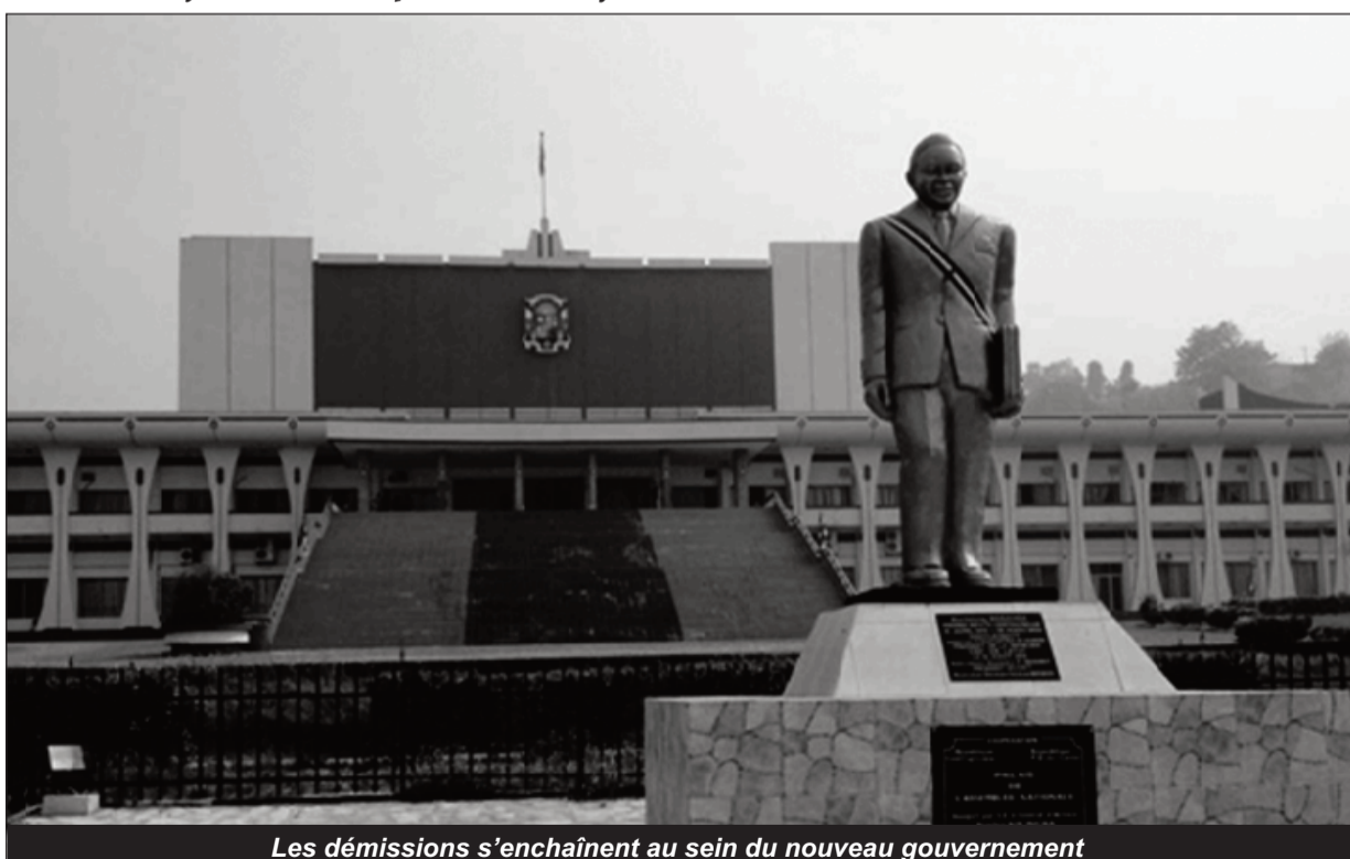
Les démissions s'enchaînent au sein du nouveau gouvernement

Le Premier ministre centrafricain a fait une déclaration ce lundi. Il a affirmé que la nomination du gouvernement n'était que le début du processus. Des représentants des groupes armés se verront donner l'opportunité de rentrer dans les services de la présidence, de la primature ou encore dans les organes de suivi de l'application de l'accord. Selon les autorités, l'inclusivité ne consiste pas seulement à