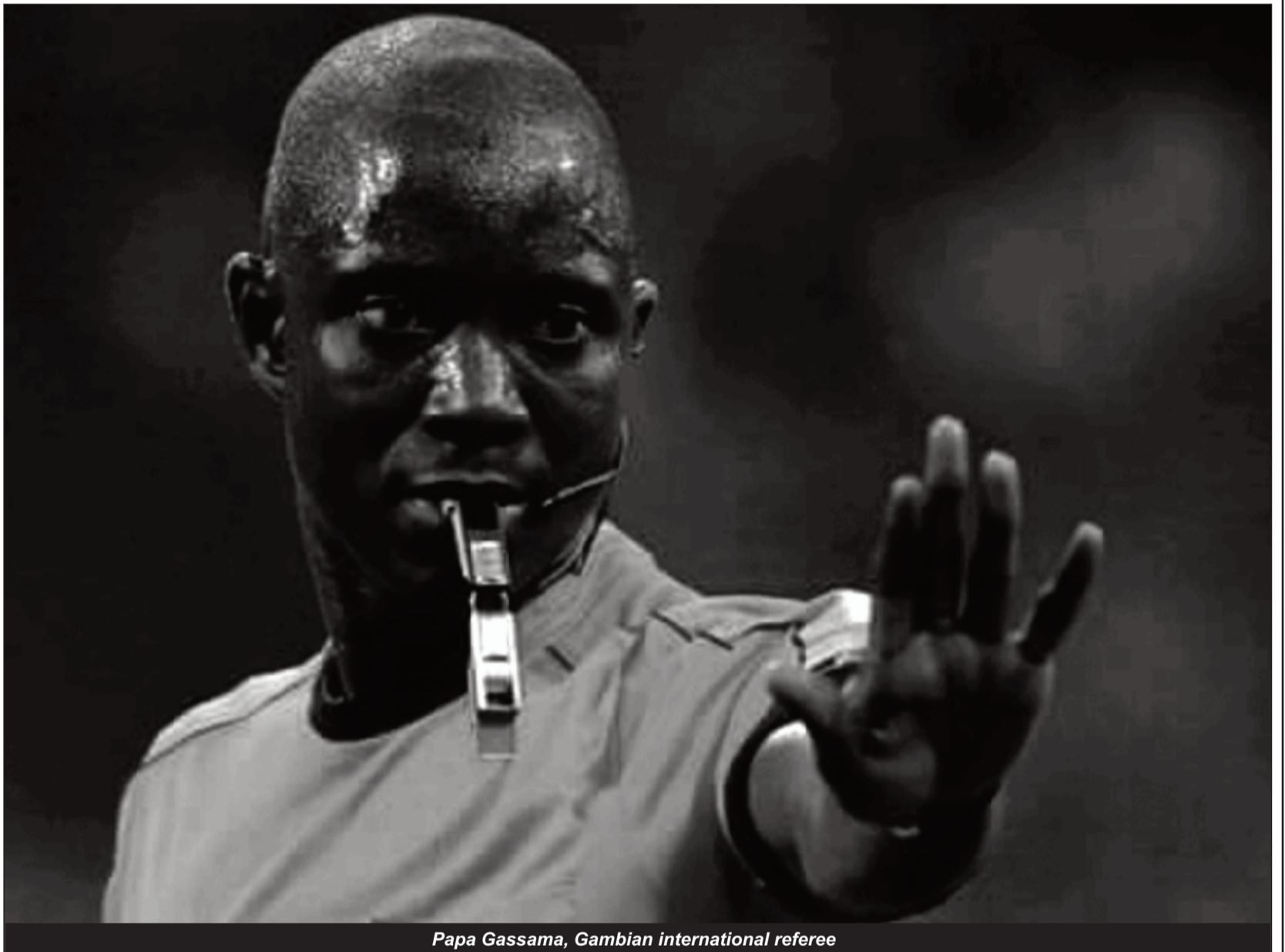
Papa Gassama, Gambian international referee

Papa Gassama is the same referee who took charge of Cameroon's 1-1 draw game against Nigeria on the 4th September 2017. The very experienced referee comes with a huge profile. Months after participating in the 2018 World