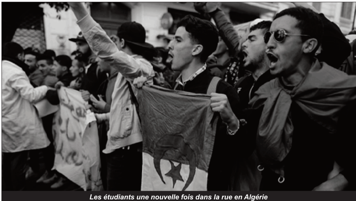
Les étudiants une nouvelle fois dans la rue en Algérie

Ce qui est nouveau ce mardi, c'est que l'on voit des enseignants aux côtés des manifestants. Une organisation de