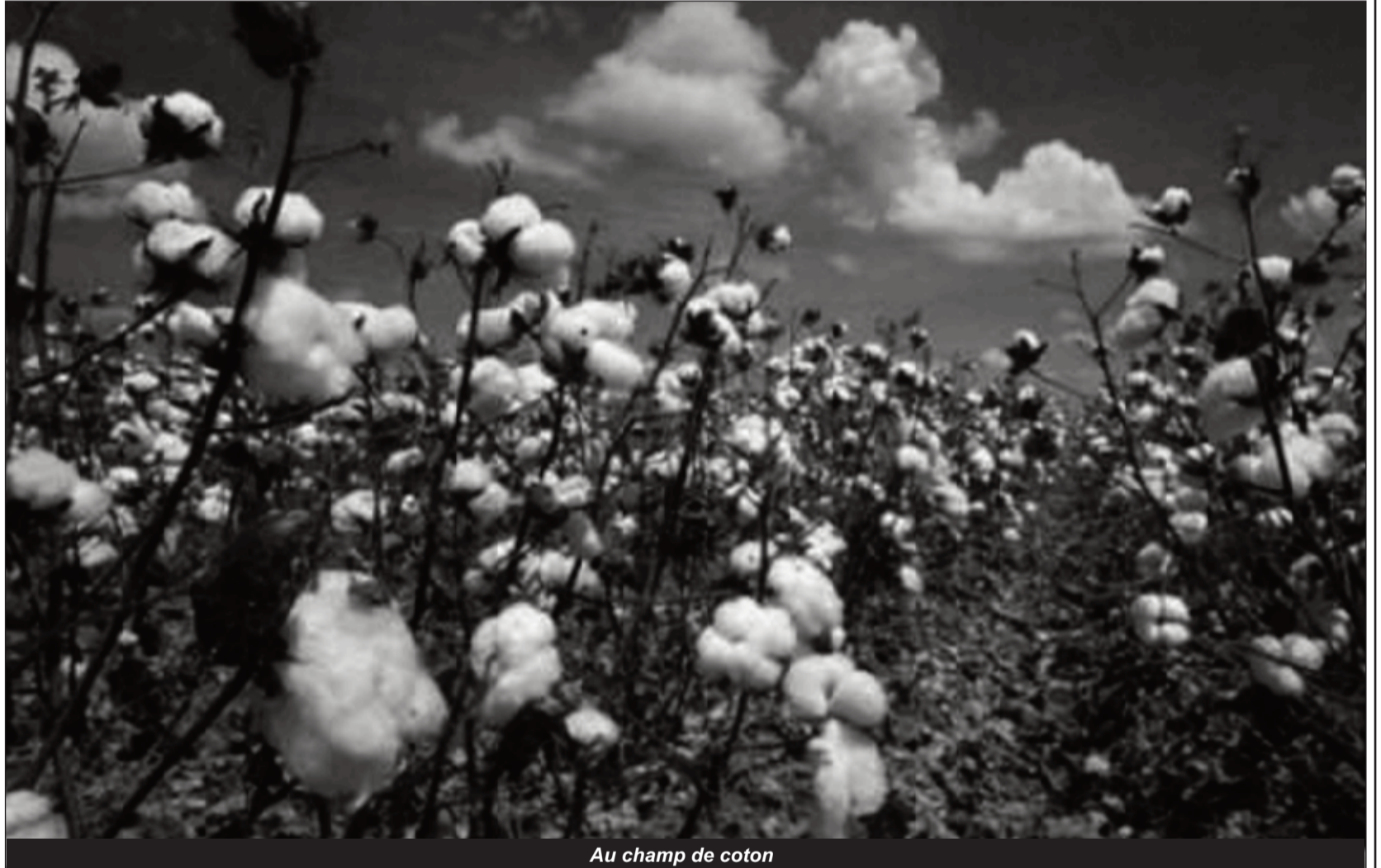
Au champ de coton

A côté d'une filière café dont les performances sont médiocres depuis des années, les exportations de cacao, elles, se sont stabilisées au cours de l'année 2018, après la baisse