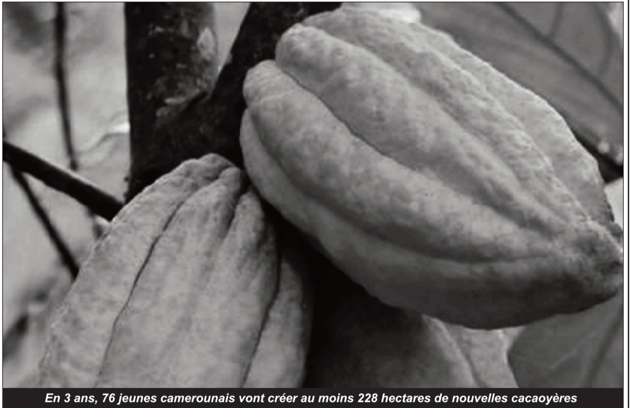
En 3 ans, 76 jeunes camerounais vont créer au moins 228 hectares de nouvelles cacaoyères

Pour rappel, « New Generation » découle d'une étude de l'Interprofession cacao-café, qui a révélé que la moyenne d'âge des producteurs de cacao dépassait 60 ans dans certains bassins de production du Cameroun. Le programme consiste à recruter des jeunes intéressés par la cacaoculture, pour une formation étalée sur une période de 3 ans, qui porte aussi bien sur les meilleures pratiques culturelles que les techniques de commercialisation de la production.