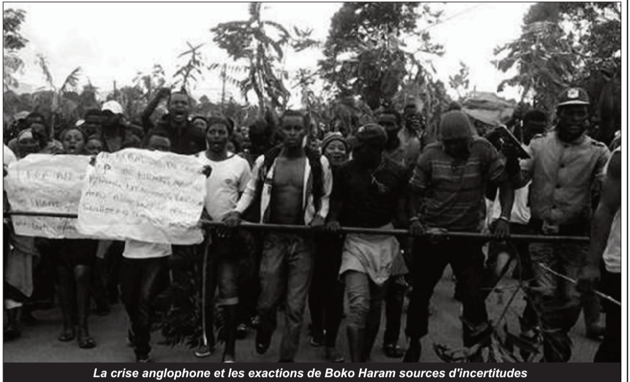
La crise anglophone et les exactions de Boko Haram sources d'incertitudes

De l'autre côté, l'on se rappelle que les fruits des initiatives du