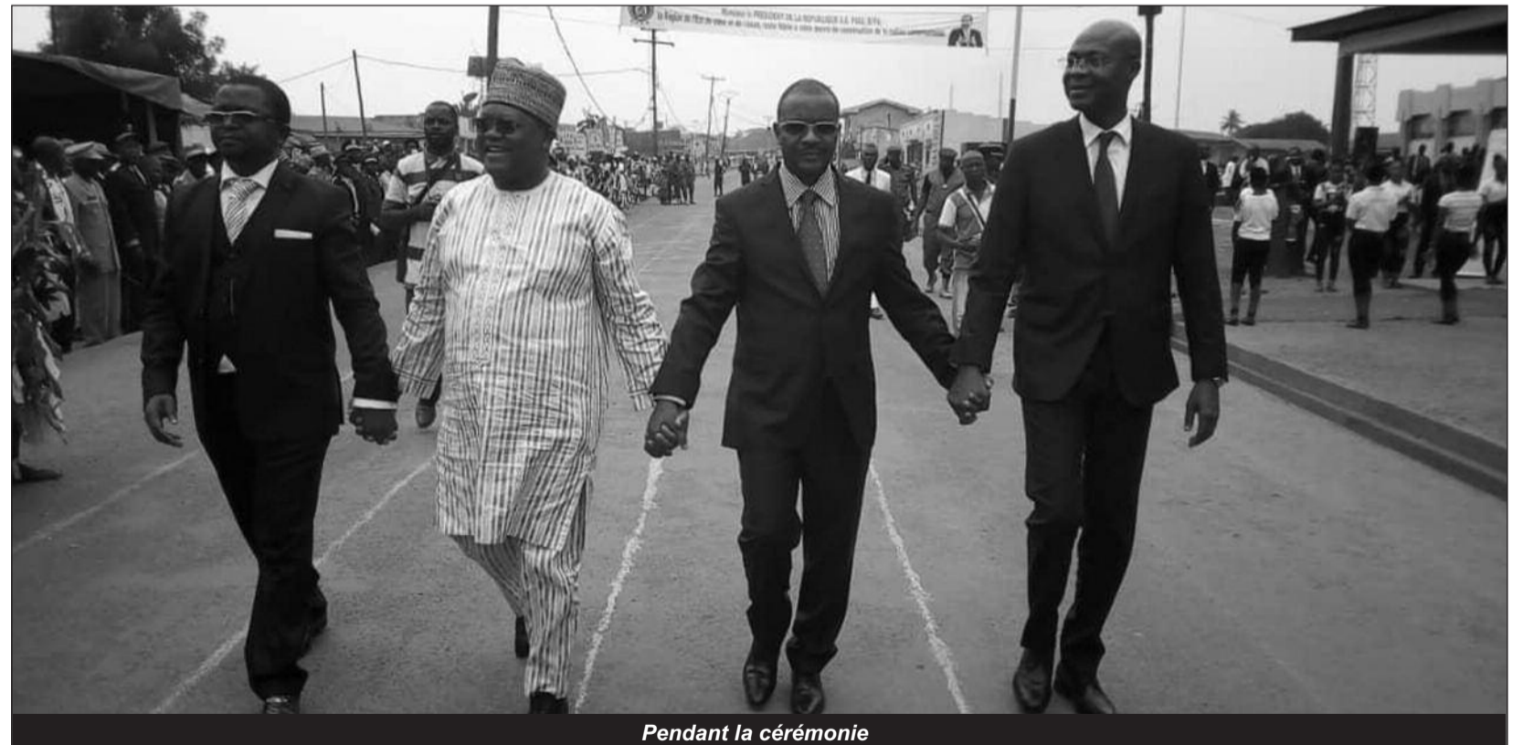
Pendant la cérémonie

Dans ce premier gouvernement des grandes opportunités que conduit Joseph Dion Nguté, premier ministre, il a honoré 06 fils de l'Est qui occupent les fonctions de ministre de la fonction publique et de la réforme administrative (Minfopra), pour Joseph Anderson Lé ; de ministre des mines, de l'industrie et du développement technologique (Minmidt), pour Gabriel Dodo Ndoké ; de ministre délégué à la présidence de la république chargé des relations