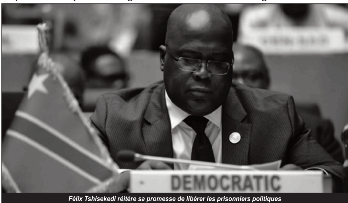
Félix Tshisekedi réitère sa promesse de libérer les prisonniers politiques

« L'Agence nationale du renseignement, qui était la police politique depuis toutes ces années, depuis notre indépendance, la police politique du pouvoir, va être requinquée, a-t-il ajouté. On va lui redonner un autre visage, plus humain. Et j'ai d'ores et déjà donné l'instruction pour que tous les cachots de ces services soient fermés, et qu'on ne puisse plus retenir des individus dans ces endroits uniquement à cause de leurs opinions politiques.