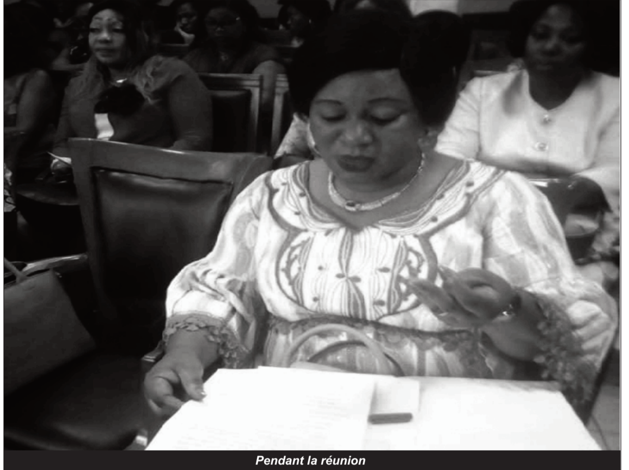
Pendant la réunion

Notons que le thème de cette année est: « Croisade contre les inégalités de sexes : s'armer à la nouvelle impulsion ». Ainsi, dans ses propos, Mme le CT1 a indiqué que les hommes et les femmes doivent travailler ensemble main dans la main, pour réduire et pourquoi pas mettre fin aux