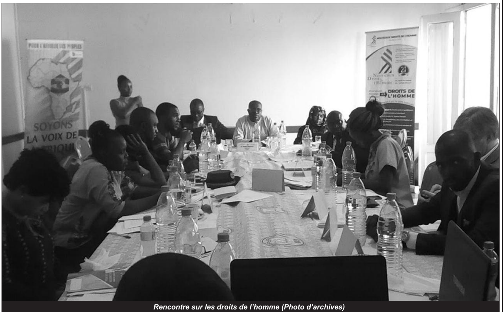
Rencontre sur les droits de l'homme

C'est donc dans ce cadre qu'il faut situer la rencontre des 04 et 05 Mars à Yaoundé sous les auspices de l'Ong, Nouveaux droits de l'homme qui entend maintenir la ligne directrice de ses activités : la lutte pour les droits de l'homme engagée il y a près d'une vingtaine d'années. Un atelier est à cet effet prévu dans le cadre du renforcement de la défense et de la protection des libertés fondamentales au Cameroun, avec l'appui des partenaires canadiens.