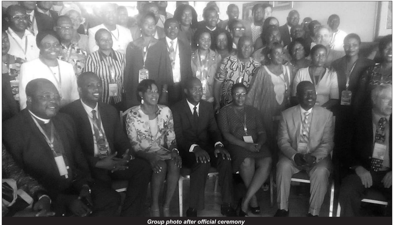
Group photo after official ceremony

"We are here to explore means and ways of bringing back primary health care to achieving universal health coverage. As you can see the African health system has challenges that we have several communicable diseases, we are suffering from disabilities and discomfort that are all avoidable. We think that at the moment, one key pathway is in ensuring that everyone living in sub-Saharan